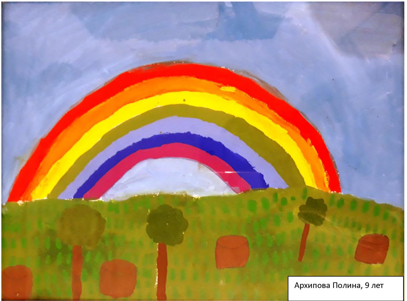
Архипова Полина, 9 лет