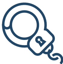
Арест до 3 месяцев

Наказывается арестом, обязательными, исправительными работами или штрафом: