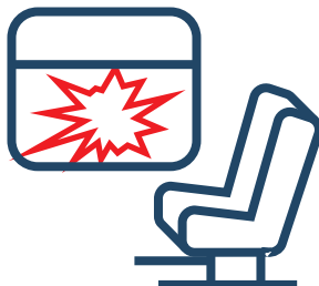
Разбитые стекла в вагоне поезда