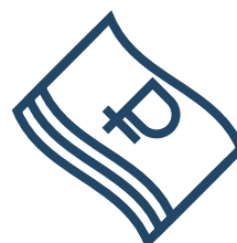
Штраф до 40 000 ₽

Те же деяния, совершенные группой лиц, а равно по мотивам политической, идеологической, расовой, национальной или религиозной ненависти или вражды либо по мотивам ненависти или вражды в отношении какой-либо социальной группы: