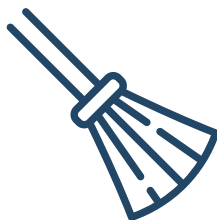
Обязательные работы до 360 часов, исправительные работы до 1 года