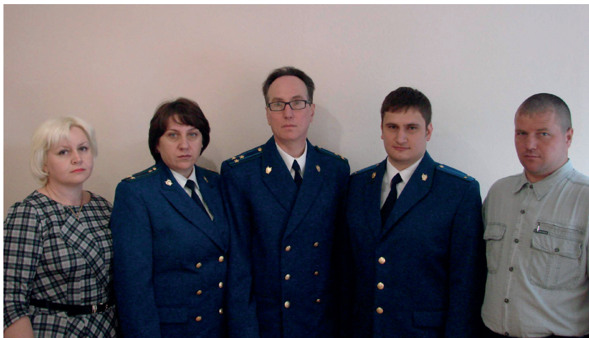
Коллектив прокуратуры района, 2020 год

В настоящее время коллектив Северного района состоит из 5 человек.