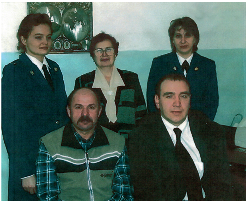
Коллектив прокуратуры 2004 г.