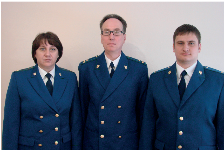
Оперативный состав прокуратуры района 2016 год

Коллектив прокуратуры повышает свои профессиональные навыки путем осуществления индивидуального обучения, так и повышает квалификацию в ведомственных учреждениях Генеральной прокуратуры Российской Федерации.