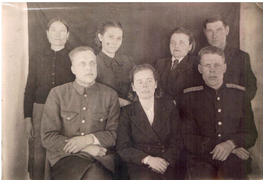
Коллективы суда и прокуратуры, предполагаемо 1960 год

С 01.01.1951 года по 20.06.1955 прокурором Северного района был Буров Д.Ф., с 21.06.1955 по 09.04.1960 - Родомакин Г.Я., с 10.04.1960 по 27.03.1963 - Тропин А.Ф.