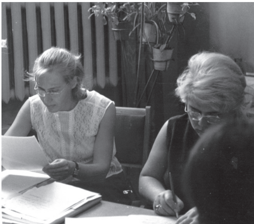
На заседании комиссии по делам несовершеннолетних