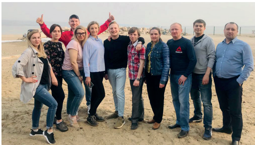
Коллектив прокуратуры района на отдыхе