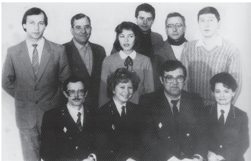
Коллектив прокуратуры района 1982 год