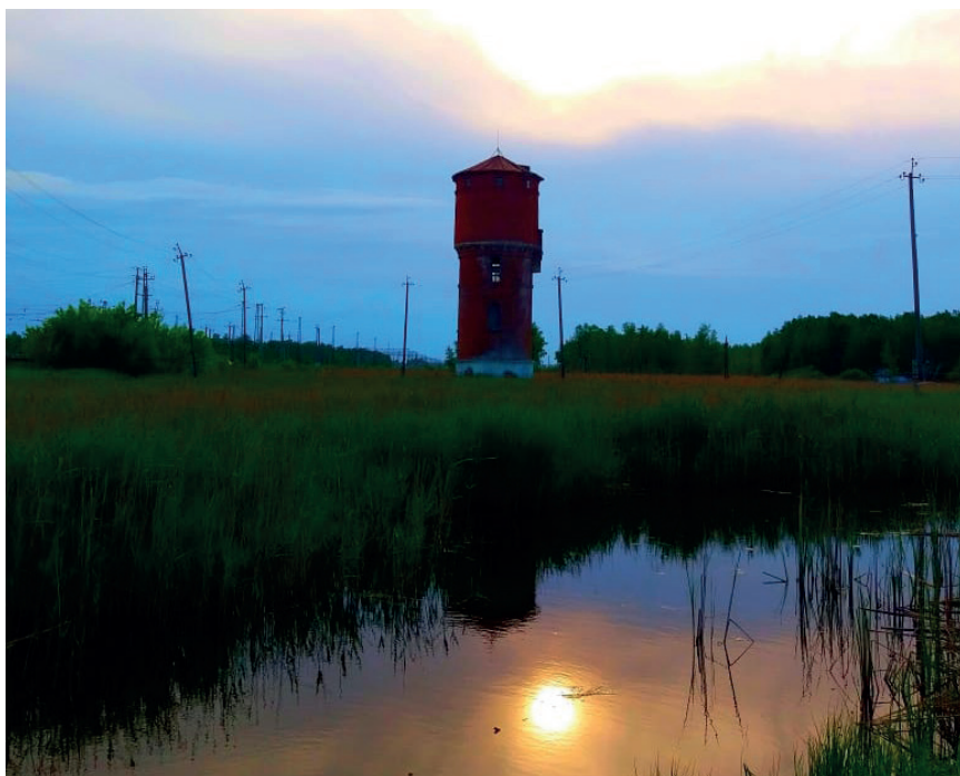
с. Убинское, Новосибирская область

Поскольку район сельскохозяйственный, основная часть населения занята именно в этом производстве. На 2019 год производством и реализацией сельхозпродукции в районе занимаются шесть сельскохозяйственных предприятий, 21 крестьянское фермерское хозяйство, 5 530 личных подсобных хозяйств. В 2019 году выполнен посев на площади 29 701 гектар, из них зерновых и зерно-бобовых — 16 333 гектар. Убрано 100 % посевной площади. Общие итоги развития аграрного сектора в экономике района: на январь 2020 года в хозяйствах всех категорий содержится 8 258 голов крупнорогатого скота, поголовье свиней — 1 735, овец и коз — 8 300, кроликов — 1 445, птиц