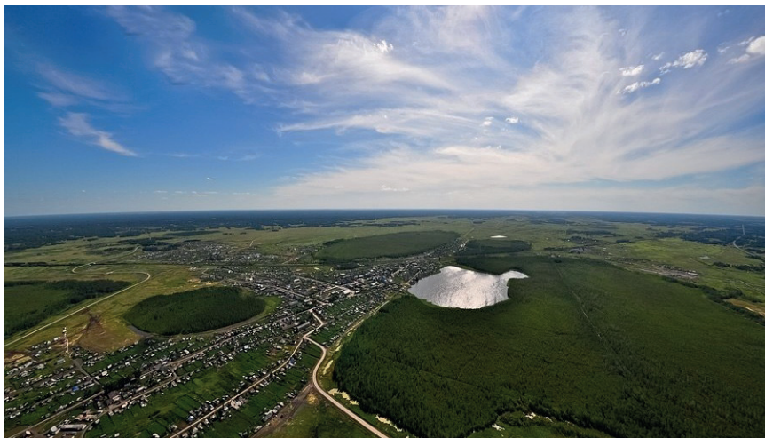
с. Убинское, Новосибирская область

Численность населения Убинского района 15 144 человек. Протяжённость дорог общего пользования местного значения Убинского района составляет 344 км, в том числе с твёрдым покрытием – 234,6 км. (68%). В настоящее время в районе 43 населённых пункта в 16 муниципальных образованиях. Самыми крупными населёнными пунктами являются сёла Убинское, Кожурла, Раисино.