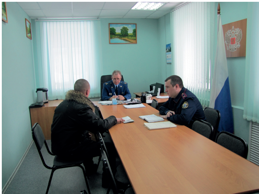
На приеме у прокурора

Ранее первый этаж здания занимали иные организации Чановского района (пенсионный фонд, ЗАГС), в настоящее время все 2 этажа заняты прокуратурой Чановского района.