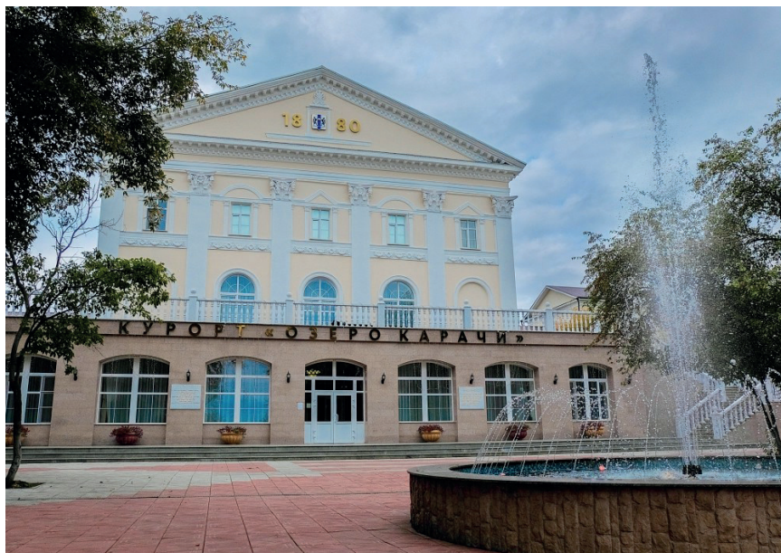
Курорт озеро Карачи

Предмет особой гордости чановцев — курорт «Озеро Карачи», характеризуется тремя природными факторами: чрезвычайно качественной минеральной водой, очень эффективной лечебной грязью и особой целебной силой рапой. Здесь же обнаружены подземные воды, содержащие йод, бром, сероводород.