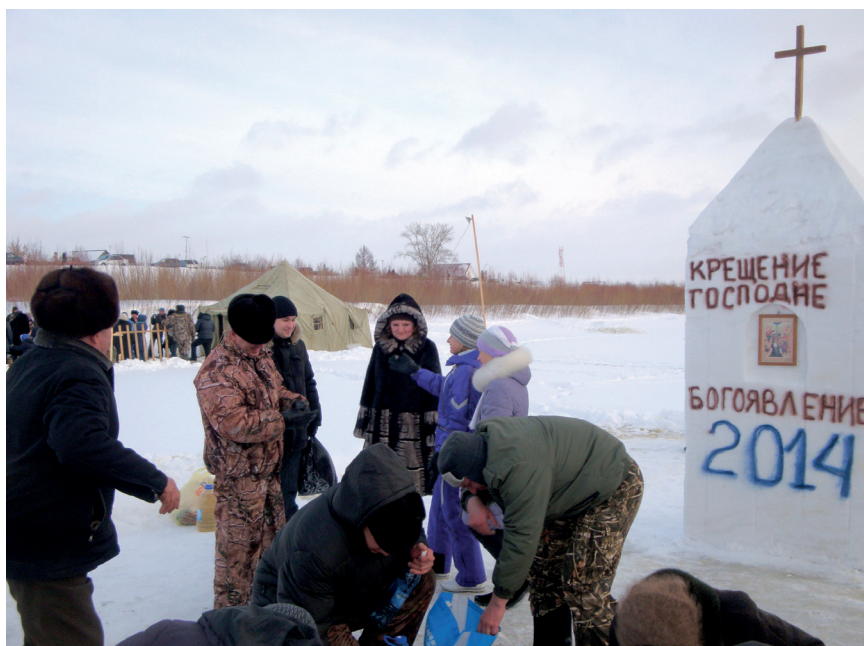
Крещение, 2014 год

На сегодняшний день моя профессия, моя работа занимает большую часть времени, я стараюсь выполнить все указания, поручения, внести свой вклад в работу всего коллектива, ведь от этого зависит не только мой личный результат, но и результат работы прокуратуры в целом.