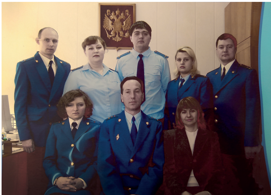
Коллектив 2006 года

С 2003 по 2012 годы прокурором района работал советник юстиции М.Н. Русин.