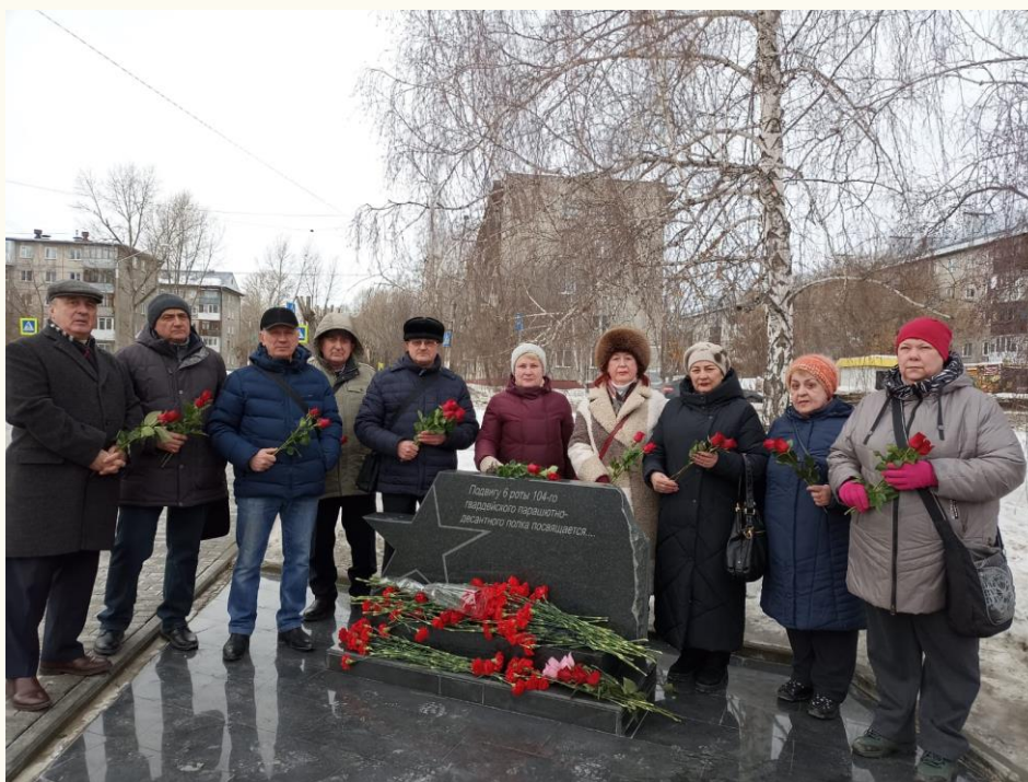
Ветераны прокуратуры возлагают цветы на Аллее памяти 6 роты 104-го гвардейского парашютно-десантного полка.