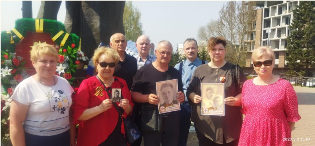
Ветераны прокуратуры возлагают цветы на Мемориале Славы