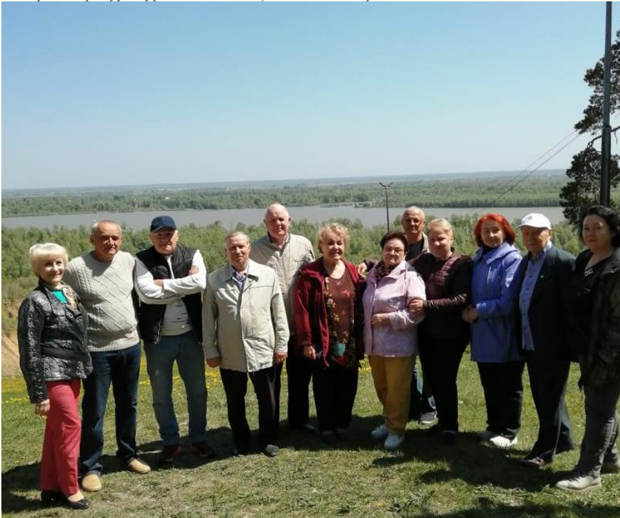
Мероприятия в день образования прокуратуры Алтайского края