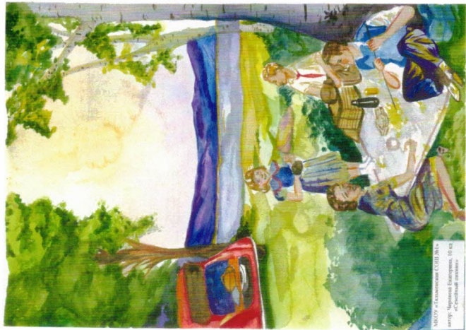
МАСТЕР-КЛАСС ПОСВЯЩЕННЫЙ СЪЕЗДУ ВЕЛОНАСТАВЩИКОВ И ПЕШЕХОДОВ В ГОРОДЕ ТАЛЬМЕНСКОЕ автор: Светлана Широмова